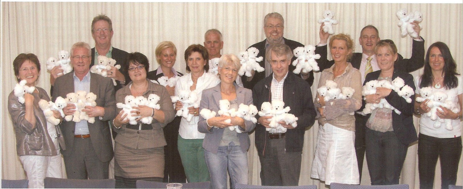
Hier ist ein Teil der Projektgruppe „Maschseumrunder 2010“ zu sehen.